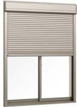
シャッター付引違い窓