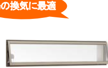
夏場の換気之最適 高所用横すべり出し窓