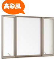
高彩風 縦すべり出し窓TFT (オペレーター)