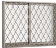
面格子付引違い窓