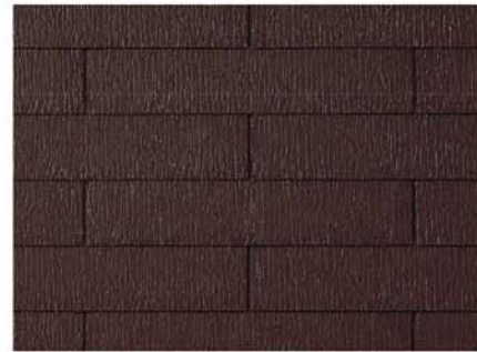
●GK121* ココナッツ・ブラウン