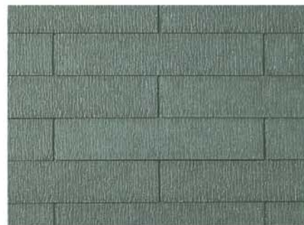
●GSK227* ラスティ・グリーン