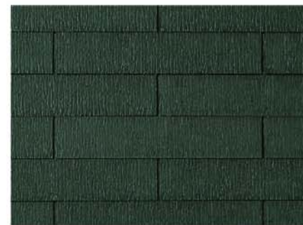
●GK247* アイリッシュ・グリーン

耐震性 地震に強い 軽量瓦です。地震の際にも住まいの躯体にかかる負担が小さくて済みます。