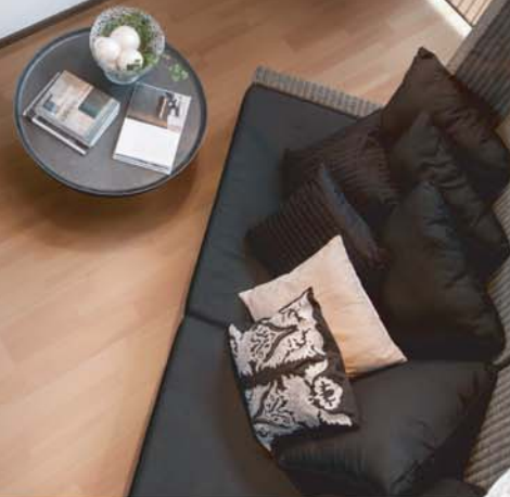
クリヤーバーチ施工例