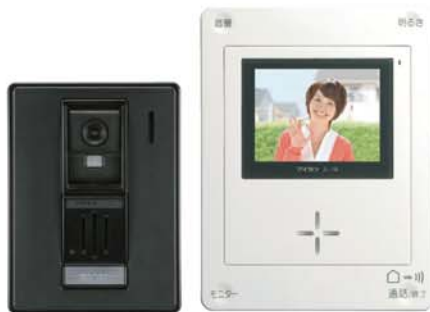
カラーカメラ付玄関子機 カラーモニター付親機