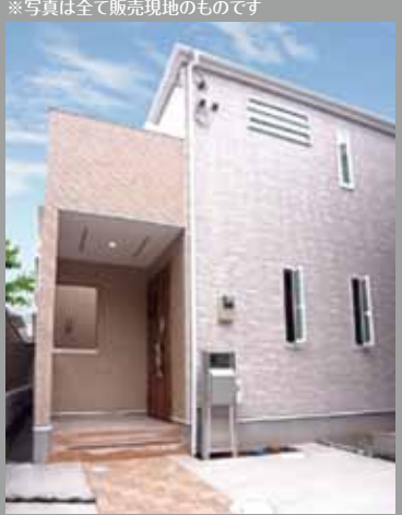
※写真は全て販売現地のものです