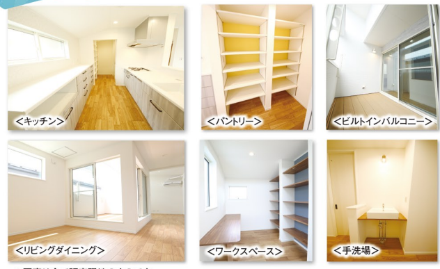
*写真は全て販売現地のもです。